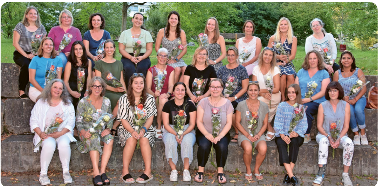
Am 1. August 2023 haben in der Primarschule und Oberstufe viele neue Mitarbeitende ihre Tätigkeit aufgenommen