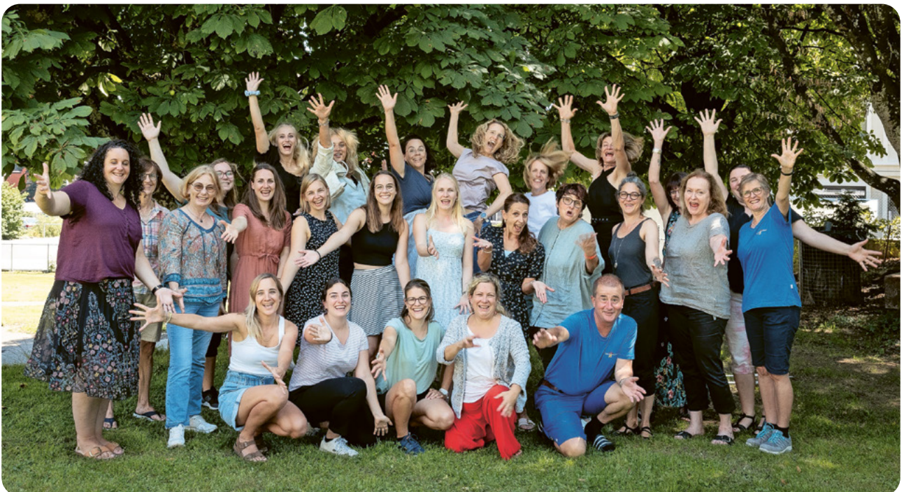
Team Schuleinheit Schöntal