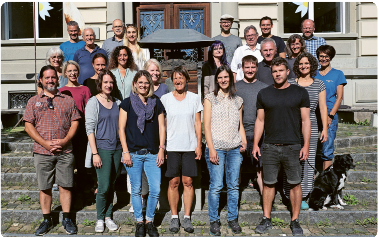
Team Schuleinheit Feld