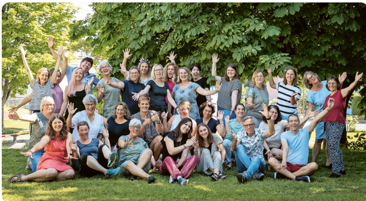
Team Schuleinheit Institut-Klaus, Kindergarten Institut