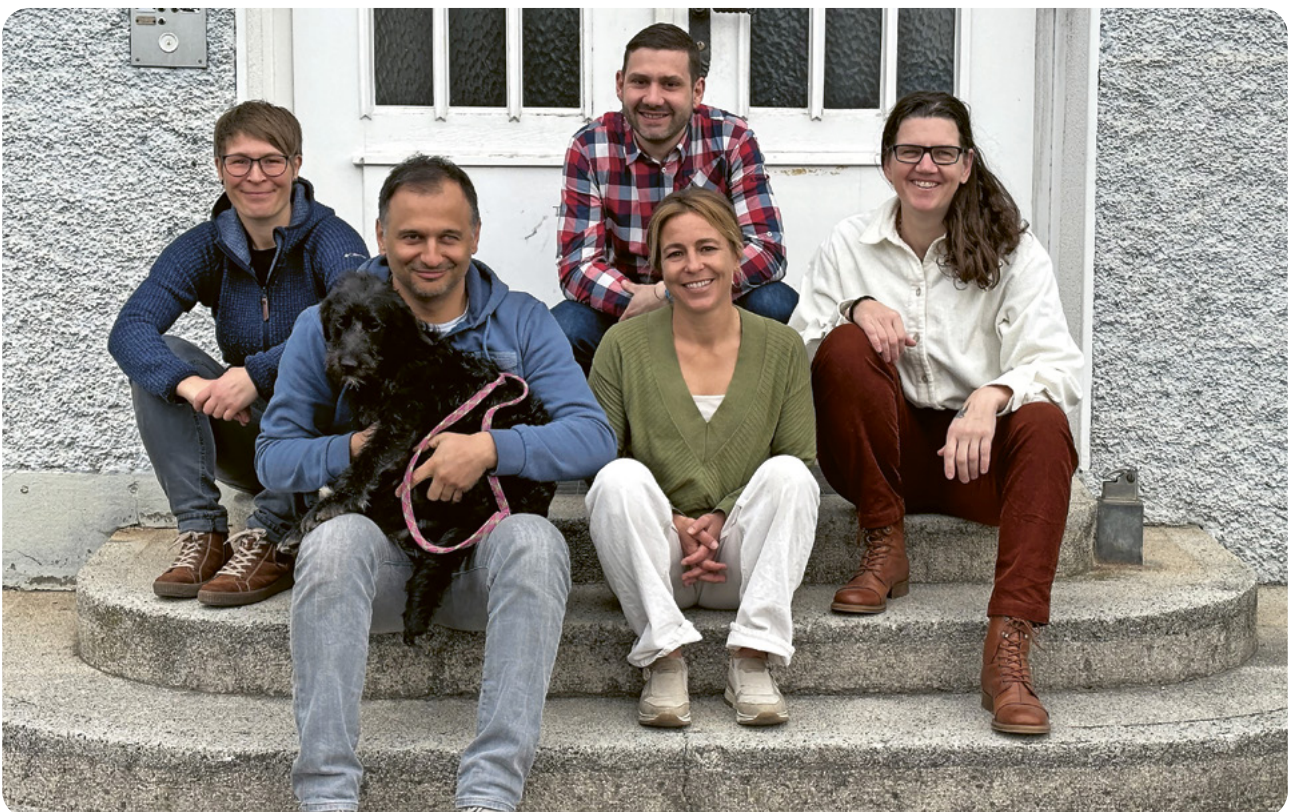
Team Regionale Kleinklasse